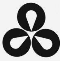
Mitsui Bussan Kaisha 1964 · Yusaku Kamekura · JP