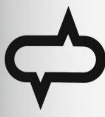
Nikon Working System 1954 · Yusaku Kamekura · JP